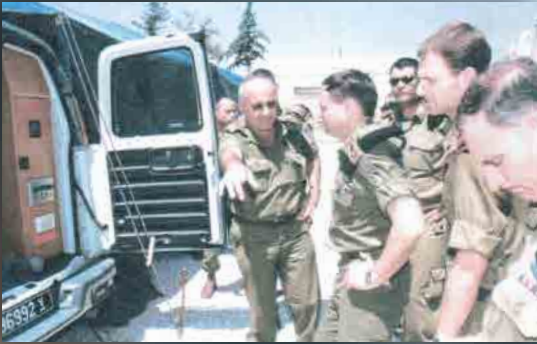
הצגת ניידת הדרכה לסגן הרמטכ"ל עוזי דיין