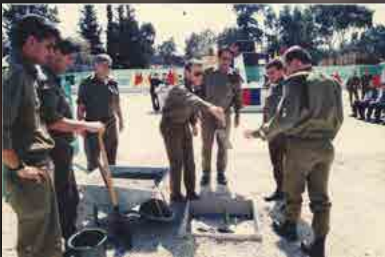
הנחת אבן הפינה למרכז הכשרות הרכב בבה"ד