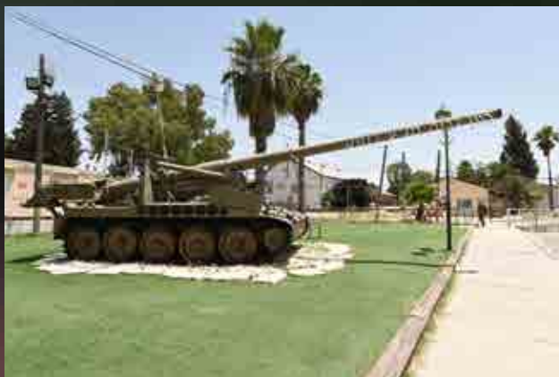
התותח בכניסה לבה"ד