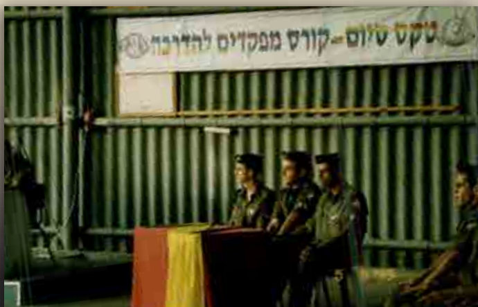
טקס סיום קורס מפקדים להדרכה