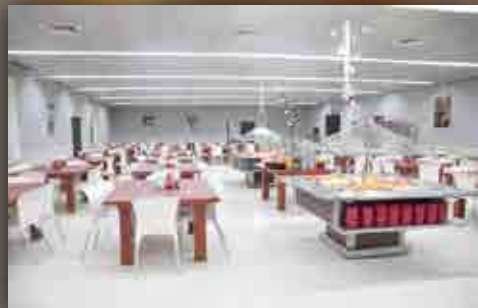
שיפוץ חדר האוכל