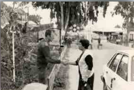
פגישה עם חברי עמותת העולים מדרום אפריקה ואנגליה בלשכת מפקד הבה"ד - 1985