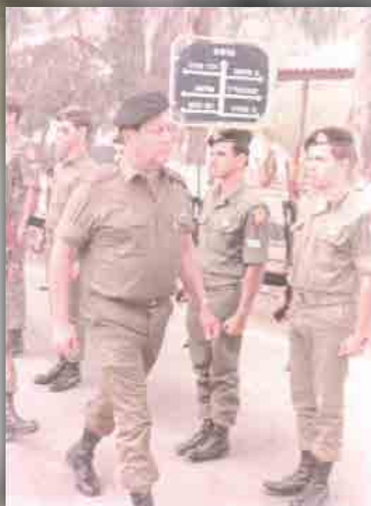
אל"מ מאיר בשן סוקר מסדר כבוד בכניסתו לתפקיד מפקד הבה"ד