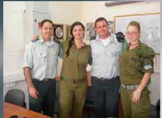
רנ"ג ישראל סוריאן (ראשון משמאל) ומד"ר הבה"ד