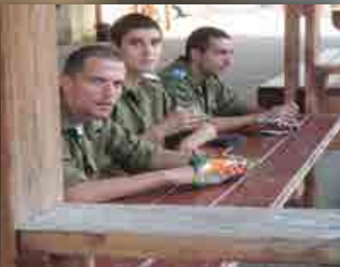
שקלית בה"ד 20