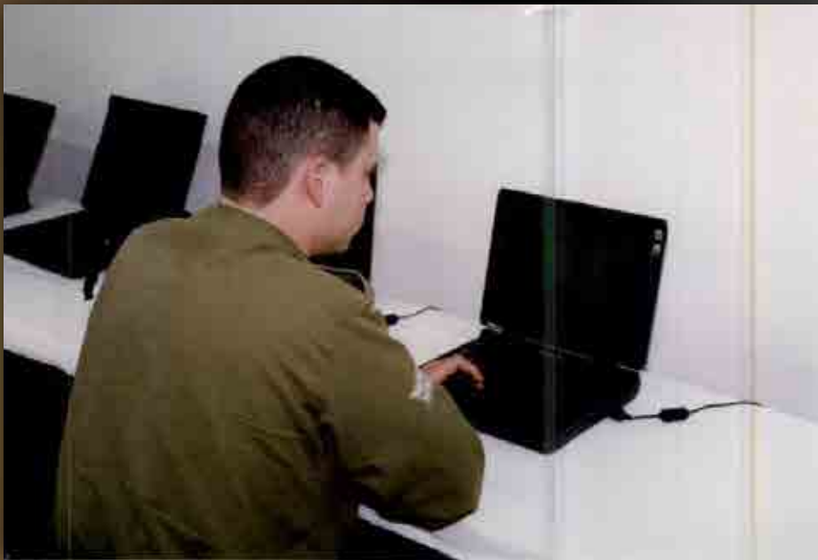
למידה בכיתת המחשבים