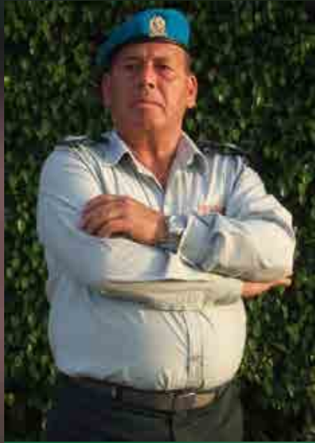
רנ"ג פרג'י לחמי