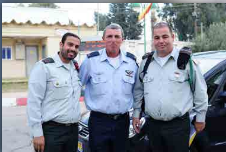
ביקור הרב הצבאי הראשי בבה"ד