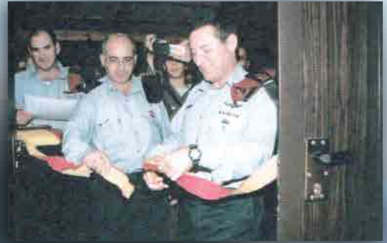
האלוף דורון אלמוג בטקס פתיחת חדר התחקירים בבה"ד