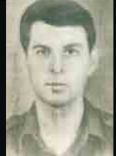
רס"ל זיס יאיר ז"ל

נולד ב- א' סיוון תש"ד נפל ב- ד' כסלו תשכ"ד נטמן בבית העלמין הצבאי בחיפה.