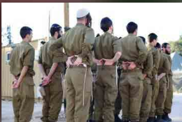
טירונות החרדים בבה"ד