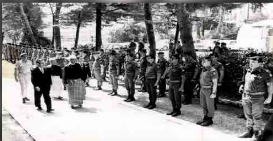
ביקור בכירים מצד"ל בבה"ד