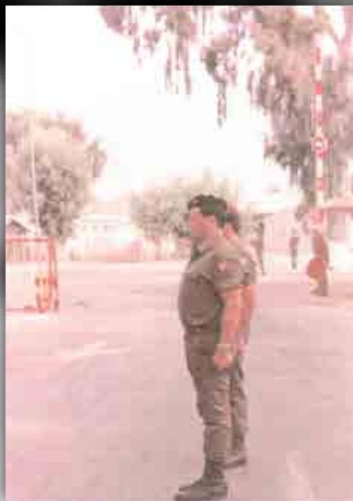
טקס החלפת מפקדים - ספט' 1982