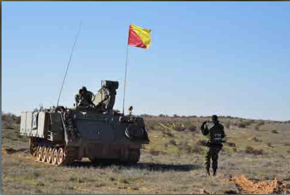
תרגיל "מנעול כחול" על נגמ"שים