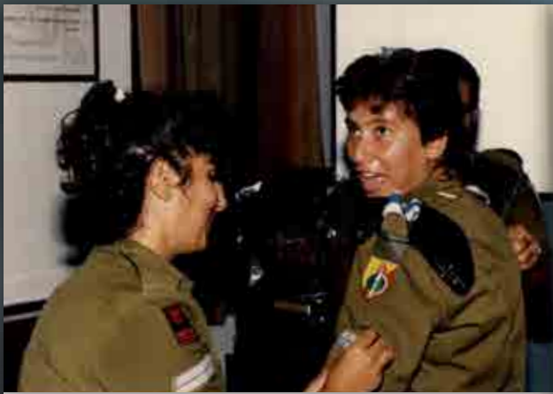
חיילות בקורסים בבה"ד 20