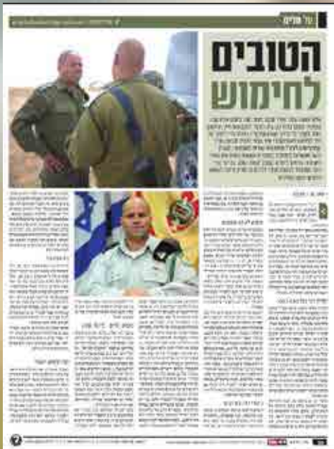
בה"ד 20 בתקשורת