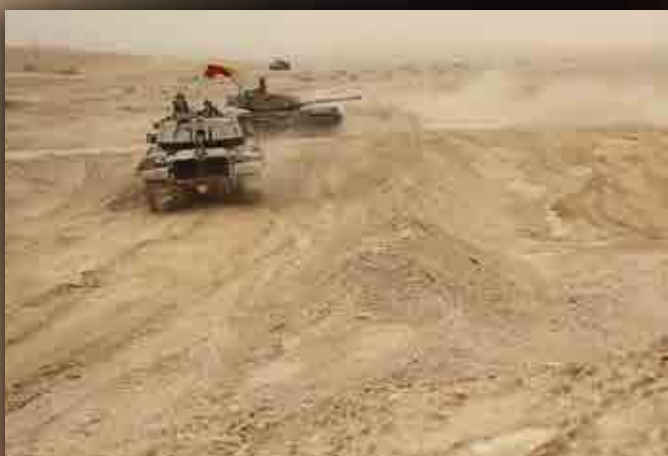
סדרת נהיגה בדרום