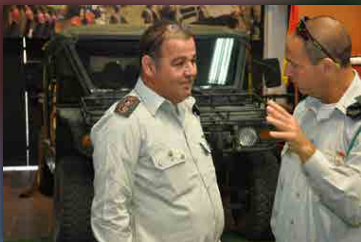
השתתפות הבה"ד בתערוכת אוטומוטור