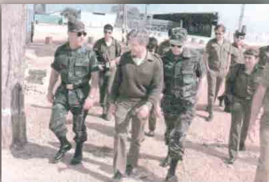
ביקור קצינים מצבא ארה"ב בבה"ד 20