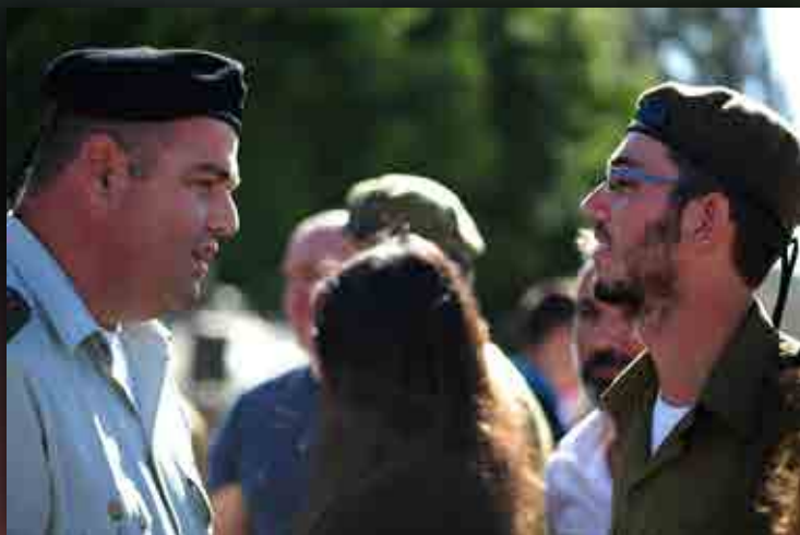
אל"ם בן הרוש מברך מצטיין בטקס סיום הטירונות