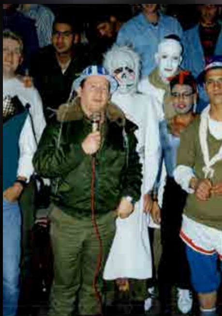
מסיבת פורים בבה"ד - 1992