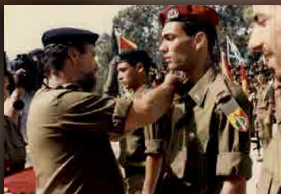
טקס סיום קורס קצינים ברחבת המסדרים החדשה