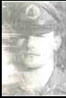
סגן שטרנהיים יואב-יחזקאל (יאנוש) ז"ל

נולד ב- כ"ד בטבת תש"ב נפל ב- כ"ג חשון תשכ"ג נטמן בבית העלמין הצבאי בחיפה.