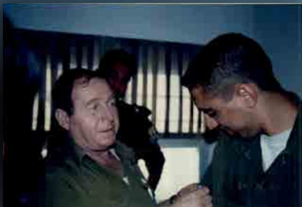
טקס סיום קורס מפקדים להדרכה