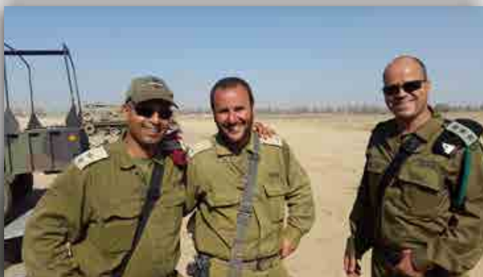
ביקור בחטיבת הצנחנים במבצע "צוק איתן"